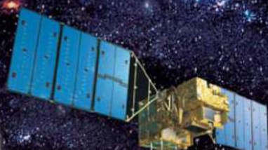
温室効果ガス観測技術衛星「いぶき」(GOSAT)