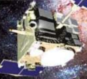
宇宙ステーション補給物「こうのとり」(HTV)