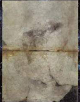
▲キトラ古墳天文図 (国・文部科学省蔵) ※展示は複製