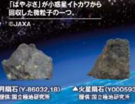
▲月隕石 (Y-86032, 1B)