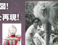
ウルトラマン