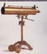
固定一貫音が製作した 反射望遠鏡(復元)個人蔵