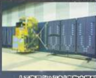
人工衛星「いぶき」実物大模型