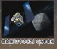
探査機「はやぶさ2」