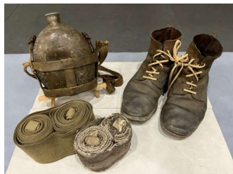
兵隊さんが使っていた水筒・靴・巻脚絆

せんじちゅう 戦時中はどんな暮らしをしていたのかな？展示を見て考えてみよう。また、 へいわ 平和の たいせつさについて考えてみよう！