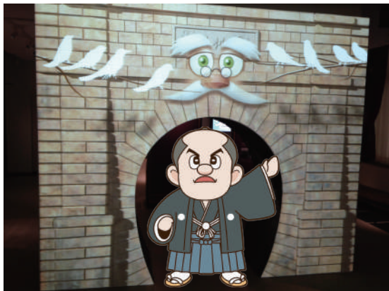
トンネルは小さいので、くぐるときは気を付けて!

人物展示室には推定年齢120歳の「ささじい」がいます。「ささじい」こと笹子隧道(トンネル)は、山梨の歴史を100年以上見てきました。ちょっと「ささじい」の話を聞いてみましょう。