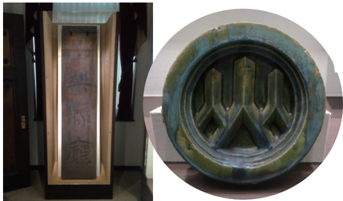
左は昭和時代に使われていた「山梨県庁」の看板 右はいまでも使われている「山」マークの瓦(かわら)

情報展示室には、県指定文化財になっている県庁舎別館にまつわる資料が展示されています。展示品を見たら、実際の建物の特徴をしらべてみよう。