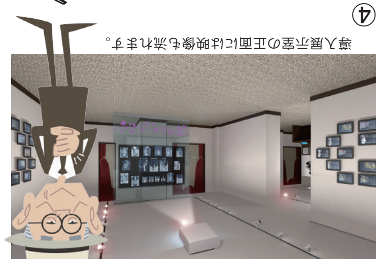
導入展示室の正面には映像も流れます。

導入展示室の「やまなしのかお」には、50人の人物が「何をしたら」人か、どんなことを残したかを紹介しています。50人のなかから気になる人を見つけて、いろいろ調べてみましょう。