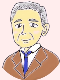
こばやし いちさぶろ 小林 一三

わたしは、人とは違った あたら 新しいアイデアを おも 思いつくのが得意! どんなことをしたと 思いますか?