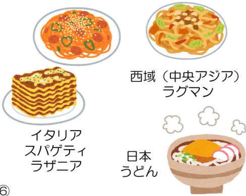
西域 (中央アジア) ラグマン 日本 うどん イタリア スパゲティ ラザニア

メソポタミア生まれの小麦がシルクロードを渡って中国へと伝わり、そこで小麦は麺として生まれ変わると、再びシルクロードの西へ東へと伝わりました。これほど豊かな広がりを見せた食べ物は珍しいです。