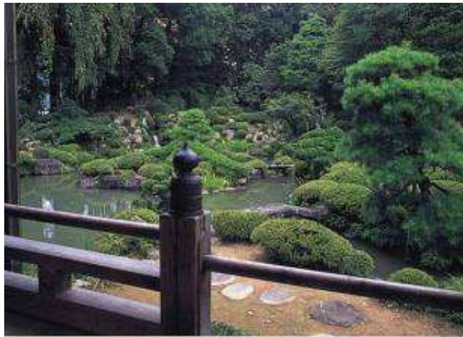
恵林寺庭園・園庭名残

1 恵林寺庭園 福山市小泉敷 恵林寺 昭和十九年六月二十六日重要文化財指定 恵林寺は臨済宗の寺院で、山号は乾徳山と称している。元徳二年（一一三〇）に夢窓疎石によって開山したが、もとは当地を領する二階堂出羽守（のちに入道して道鑑を名乗る）の邸宅であった。もともと夢窓は弘安元年（一一七八）四歳のときに父母とともに一家で伊勢から甲斐に移住し、九歳で市川の白雲山平塩寺にはいり、空阿上人のもとで出家した人である。甲斐への思いは強かったといえよう。