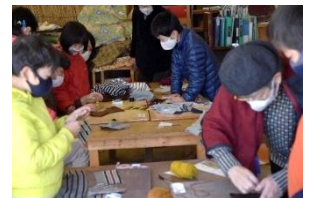
さくらの花のヘアーバンド・昨年作った三角と四角をくみあわせた帽子